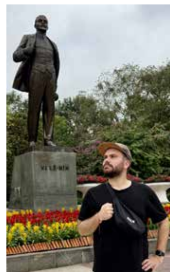
Socha Lenina v Hanoji.