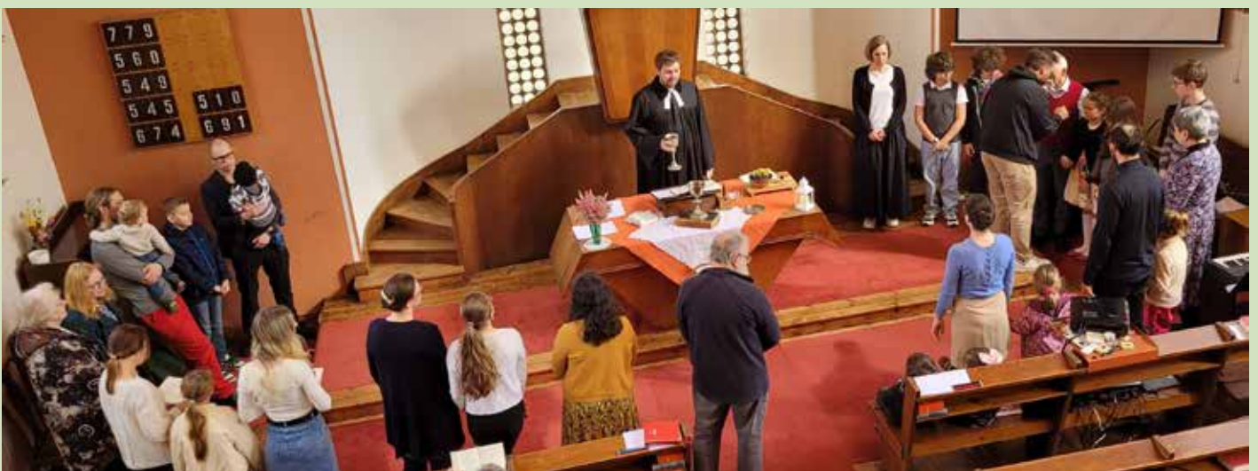
Večeře Páně. Ke stolu Kristovu jsou zváni všichni bez rozdílu církevní příslušnosti. Pojďte a přijměte Kristovo pozvání do blízkosti jeho lásky, odpuštění, pravdy a milosrdenství.