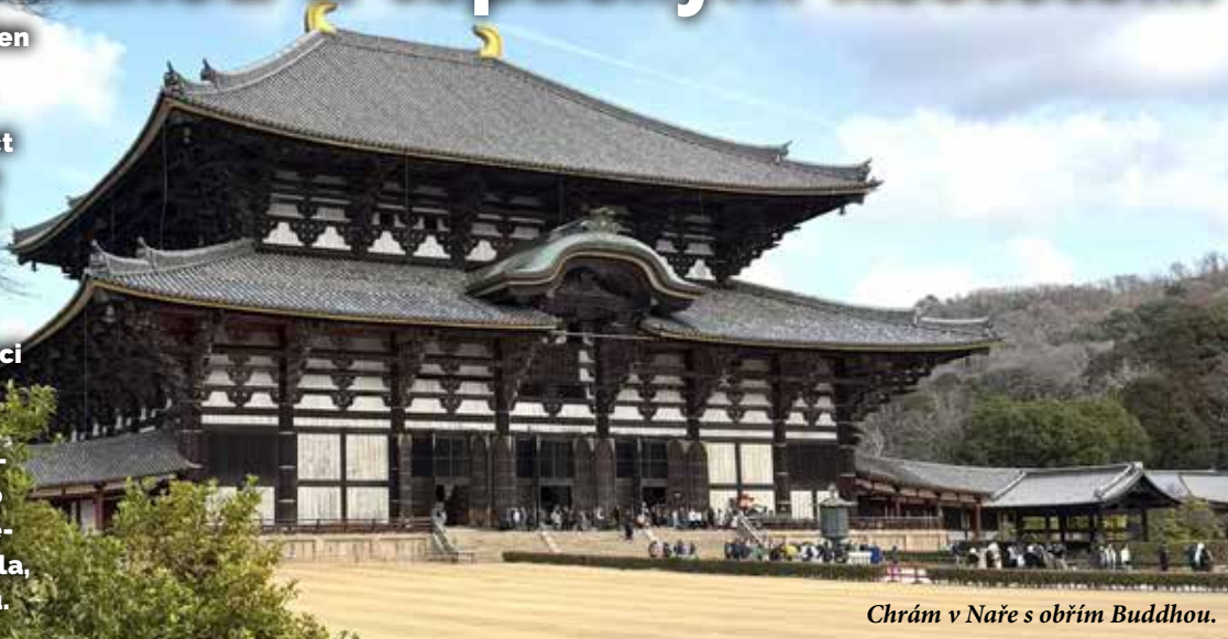
Chrám v Naře s obřím Buddhou.

V japonské Naře stojí jeden z největších dřevěných chrámů na světě. Uvnitř sedí obří Buddha. Patnáct metrů bronzu. Když jsem tam stál mezi tisíci lidmi z celého světa, uvědomil jsem si zvláštní věc: ten chrám už několikrát shořel. A stejně ho Japonci znovu postavili. Poprvé v osmém století. Potom znovu. A znovu. Války, požáry, zemětřesení. Přesto vždycky přišla nová generace lidí, která se rozhodla, že to celé stojí za obnovu.