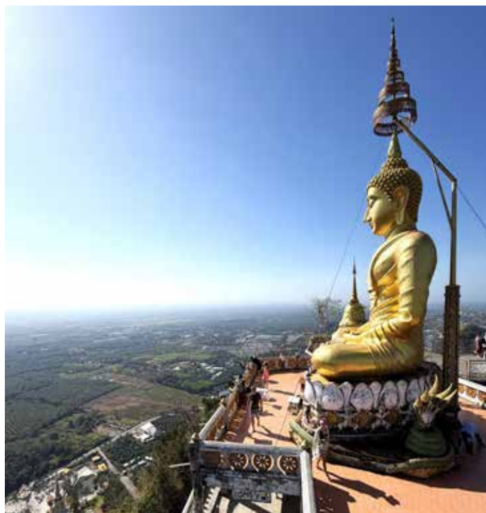
Buddhistický chrám Tygři jeskyně v Krabi v Thajsku.