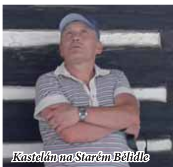
Kastelán na Starém Bělídlu

Prohlédli jsme si zámek, viděli jsme pracovnu, ložnici i garderobu kněžny Zaháňské, vyslechli příběhy její i jejích čtyř schovank, které spisovatelka vtělila do role slečny Hortensie, Ludrův mlýn, babiččin pomník od vynikajícího sochaře Otto Gutfreunda, který byl s velkou slávou odhalen v roce 1922, došli jsme ke Starému Bělídlu i k takzvanému Viktorčině splavu na řece Úpě. Zabrало nám to celé odpoledne, ale zdraví a rádi jsme se vrátili na zámek. Bylo totiž horko k zalknutí.