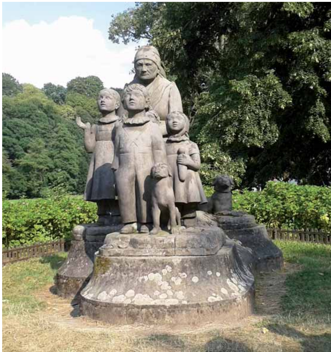
Legenda praví, že děti se dívají na hvězdnou oblohu. Babička jim vysvětluje, že každý člověk má svoji hvězdu. Lidé Bohem vyvolení mají podle ní hvězdy jasné, lidé jako Viktorka mají hvězdy zakalené...