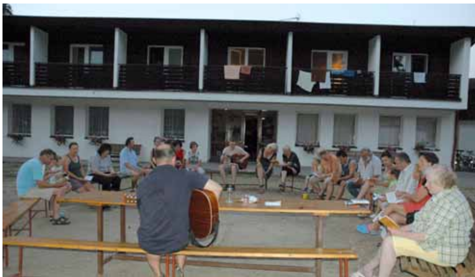
Závěrečná bohoslužba včetně vysluhování sv. Večeře Páně se konala venku před naší ubytovnou.

lohou je zoufalost! To nejde dělat celý život. Nelze neustále jen hledat a hledat. Když člověk najde to nejdůležitější, je nutné jednat. Najít nestačí!