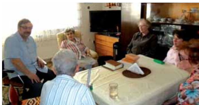
... a u Jany a Ámose Tejkalových.