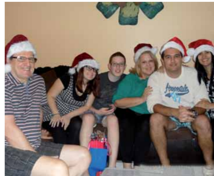
Vánoční pozdrav nám poslala rodina Jílovských z Floridy.