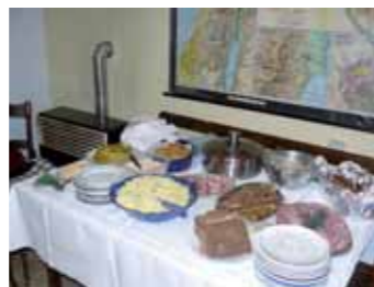
V presbyterně pak na všechny čekal bohatý raut.