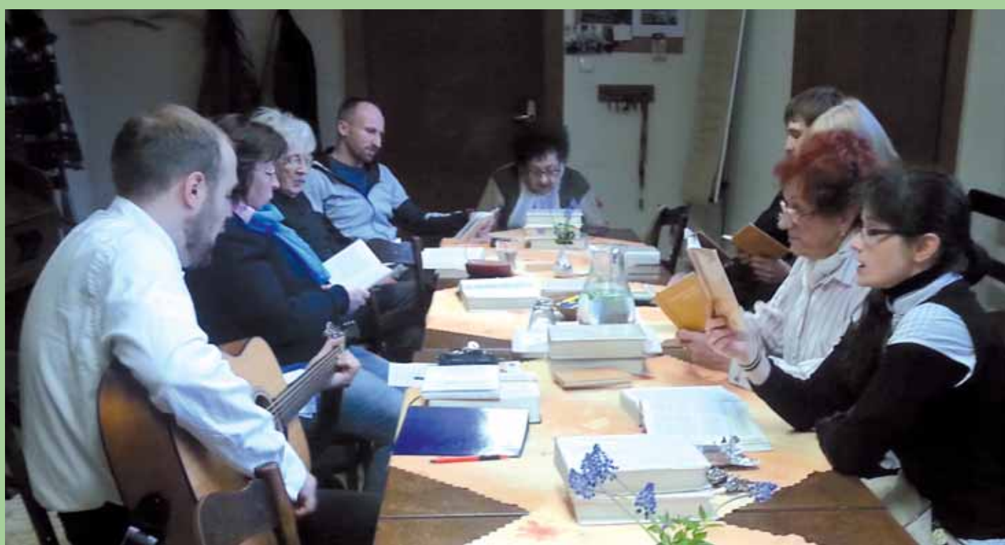
K pravidelným setkáváním nad "knihou knih" patří úterní Biblické hodiny, kde je momentálně na programu Desatero, a Pátečníci s proroky.

„A proč jsi to líp nezařídil ty, Israeli? Proč jsi nechal svůj hřích zajít tak daleko, že jsem ti musel dát do nosu až já?“ „Jenže já jsem jenom člověk.“